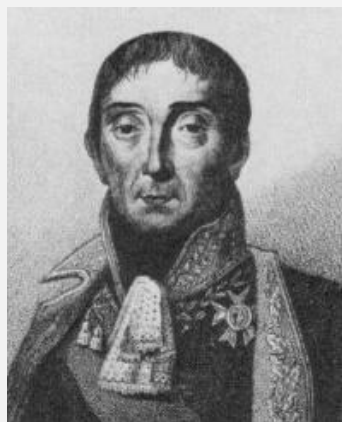
Ж. Фуше (аноним, период Империи)

революционеров отчаянными фанатиками, пусть и зачастую восхищался ими. Это позже, в 1936 г., когда проявился страшный немецко-фашистский фанатизм, Цвейг в «Кастельо против Кальвина» катком пройдет по религиозному фанатизму и культовой ярости креатора безусловного предопределения, принесшего столько бед человечеству. А до того он постоянно называет Фуше Mitrailleur de Lyon 75 , и профильный декрет вызывает у автора только отрицательные чувства. Такие же он хочет вызвать и у читателя.