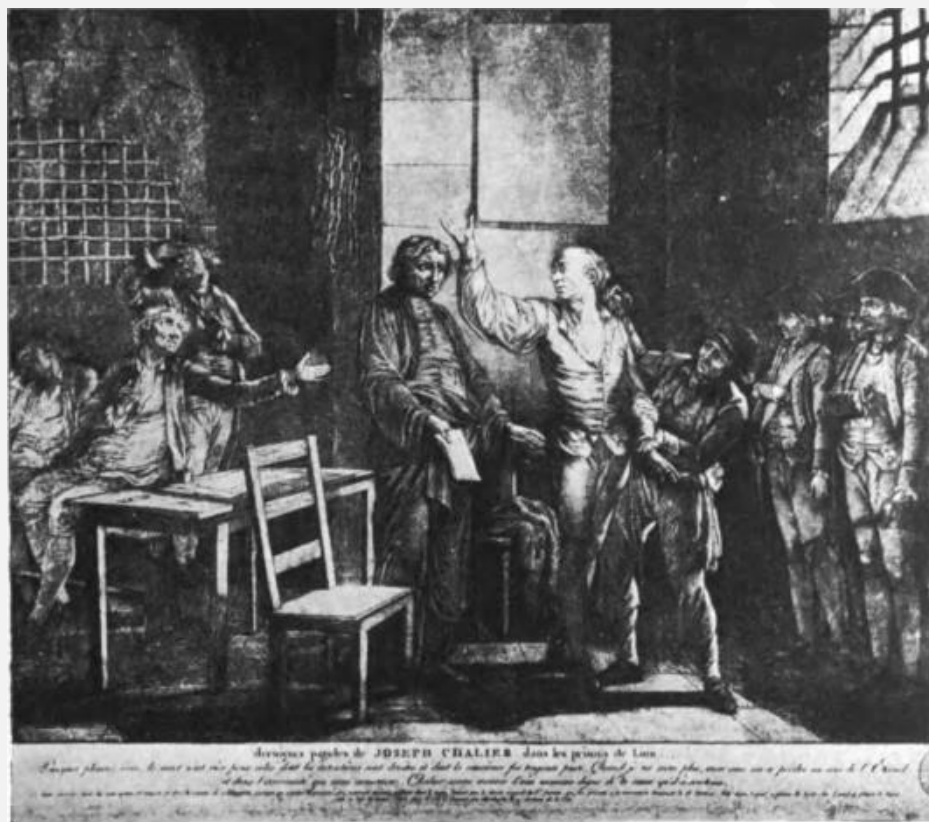
Последние минуты Шалье в лионской тюрьме. (Эстамп. Музей Карнавале.)

Но эта одиозная выходка имела обратный эффект – отвратила выборщиков от мяскаденов и вернула влияние в секциях демократам Шалье. Нивьер вновь подал в отставку, сменивший его модерантист Жилибер был арестован прокурором коммуны по подозрению в налете на Центральный клуб, наконец, выборы 8 марта выиграл друг Шалье Бертран.