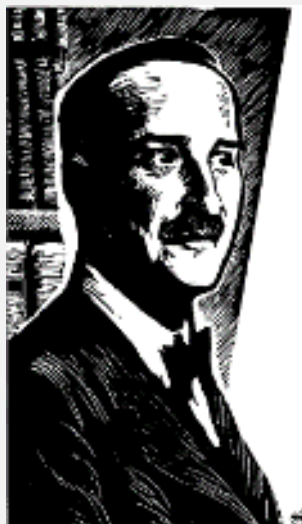
С. Цвейг (рисунок С. Бродского)

Фуше в Лионе или Карье в Нанте 77 . С подобными целями Цвейг искажил и текст декрета.