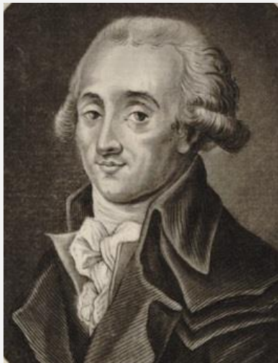
Жорж (Аристид) Кутон, депутат от Пюи-де-Дом, один из трех виднейших лидеров Монтани (эстамп)

гильотине заговорщиков, то есть мюскаденов, поднявших мятеж 51 . Позже в Лионе и Фёре были учреждены постоянно действовавшие Комиссии народного правосудия, которые занялись теми, кем до того занималась Революционная комиссия 52 . Наблюдательные комитеты из местных патриотов выявляли контрреволюционеров, которые представляли перед комиссиями.