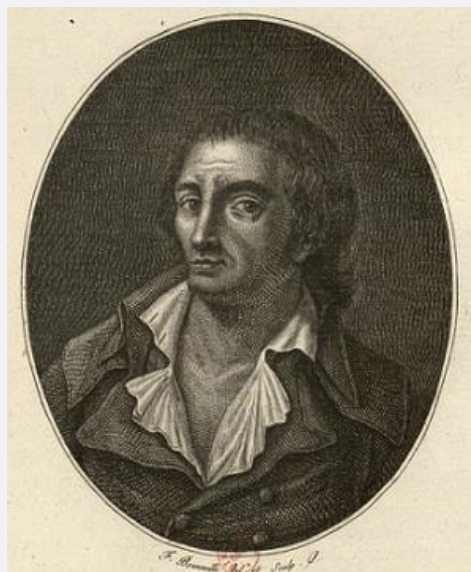
Ж.-М. Колло д'Эрбуа, депутат от Парижа, эбертист, вошедший в Комитет общественного спасения сразу за событиями 4–5 сент. (эстамп Ф. Бонвиля, BNF)

За время так называемого террора по всей стране было казнено, по приговору трибуналов и комиссий 67 16,5 тысяч, из них на Юго-Восток приходится 19% 68 , то есть 3,1 тыс. Это число коррелирует с цифрами собственно лионских казней, выводимых из предыдущих подсчетов – максимум 2,5 тыс. за весь период (октябрь–декабрь).