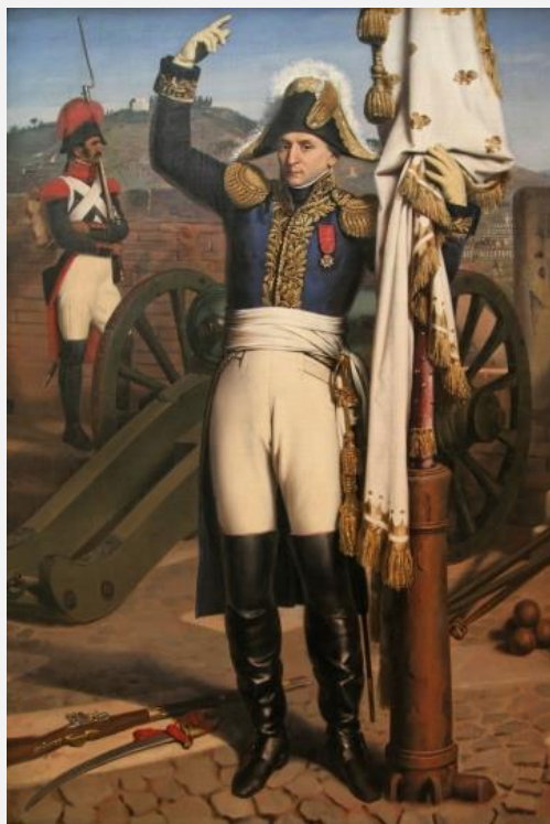
Граф Луи де Преси, вожак инсургентов Лиона (худ. Ж.-Ж. Даси)

VIII. Призывать всех честных граждан департамента Рона и Луара примкнуть к республиканским войскам, направленным против инсургентов Лиона.